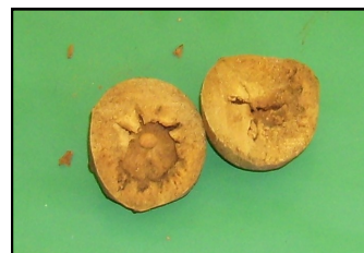
La Noce di galla aperta